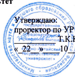
ГРАФИК (расписание) экзаменационной сессии 1 семестр 2024-2025 учебного года направление подготовки 36.05.01 Ветеринария очная форма обучения