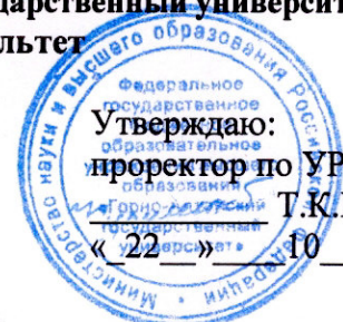
ГРАФИК (расписание) экзаменационной сессии 1 семестр 2024-2025 учебного года направление подготовки 36.05.01 Ветеринария очная форма обучения