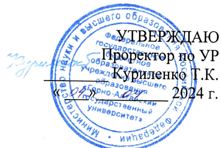
График (расписание) экзаменационной сессии 2 семестр 2023–2024 учебного года направление подготовки 44.03.05 Педагогическое образование (с двумя профилями подготовки), направленность (профили) Родной язык и Восточные языки (корейский язык) очная форма обучения