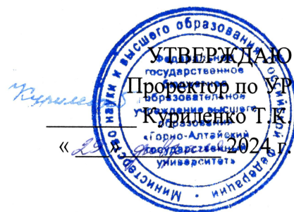
График (расписание) экзаменационной сессии 2 семестр 2023–2024 учебного года направление подготовки 45.04.01 Филология, направленность (профиль) Литература народов России (алтайская литература) очная форма обучения