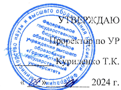
График (расписание) экзаменационной сессии 1 семестр 2023–2024 учебного года Направление подготовки 44.03.05 Педагогическое образование (с двумя профилями подготовки), направленность (профили) Родной язык и Китайский язык