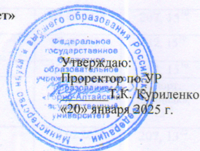
График ликвидации академических задолженностей по итогам зимней экзаменационной сессии 2024-2025 уч.года в Аграрном колледже